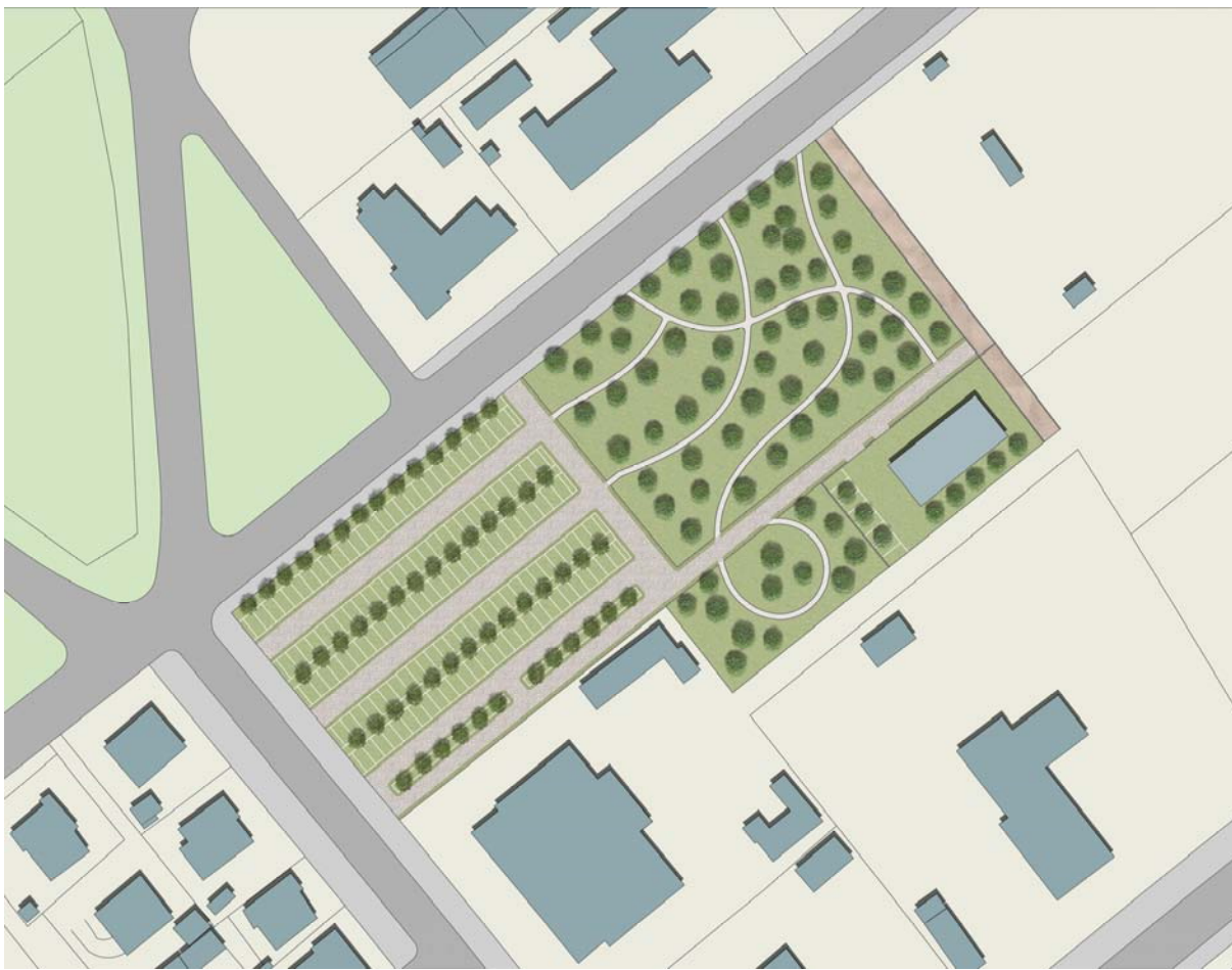
Planimetria ipotesi di fattibilità progetto area urbana