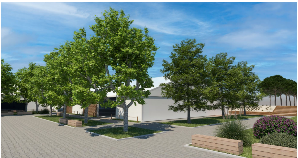
Progetto strutture sportive e sistemazione aree verdi via C. Colombo, 18 vista sud