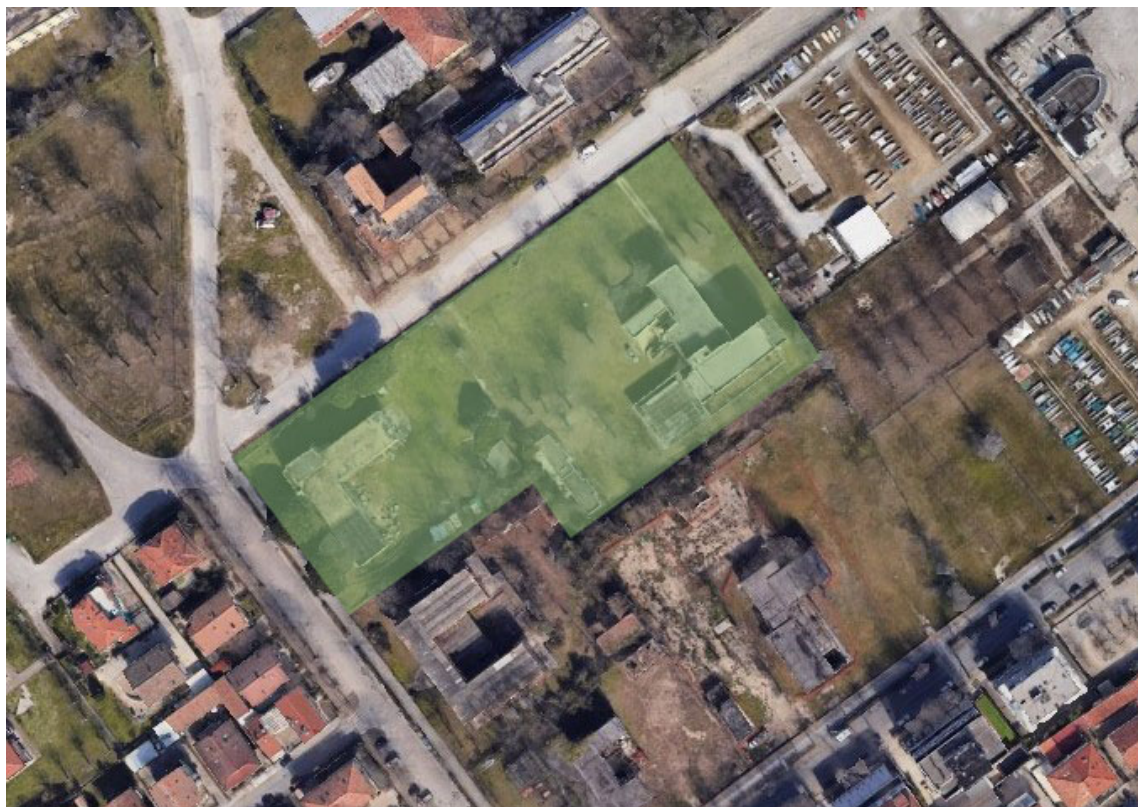
Individuazione dell'area di intervento