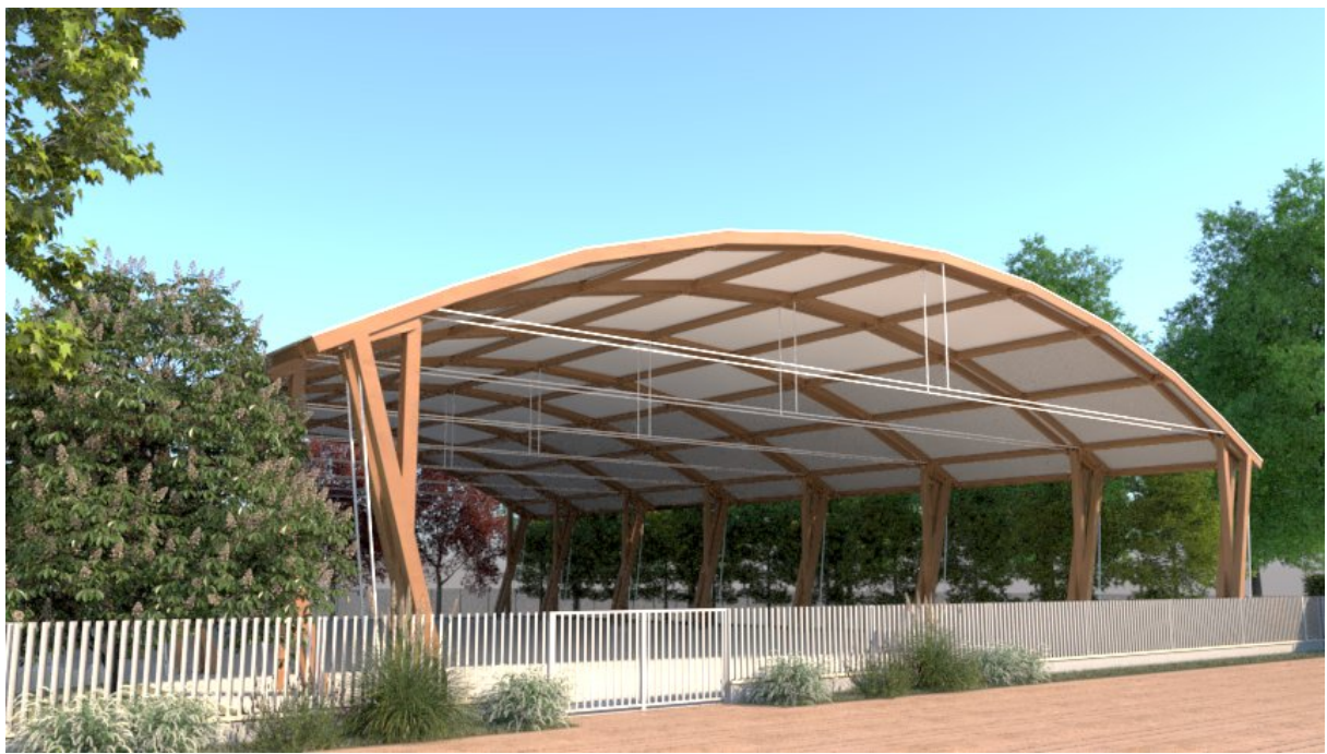
Progetto strutture sportive e sistemazione aree verdi via C. Colombo, 35 vista nord