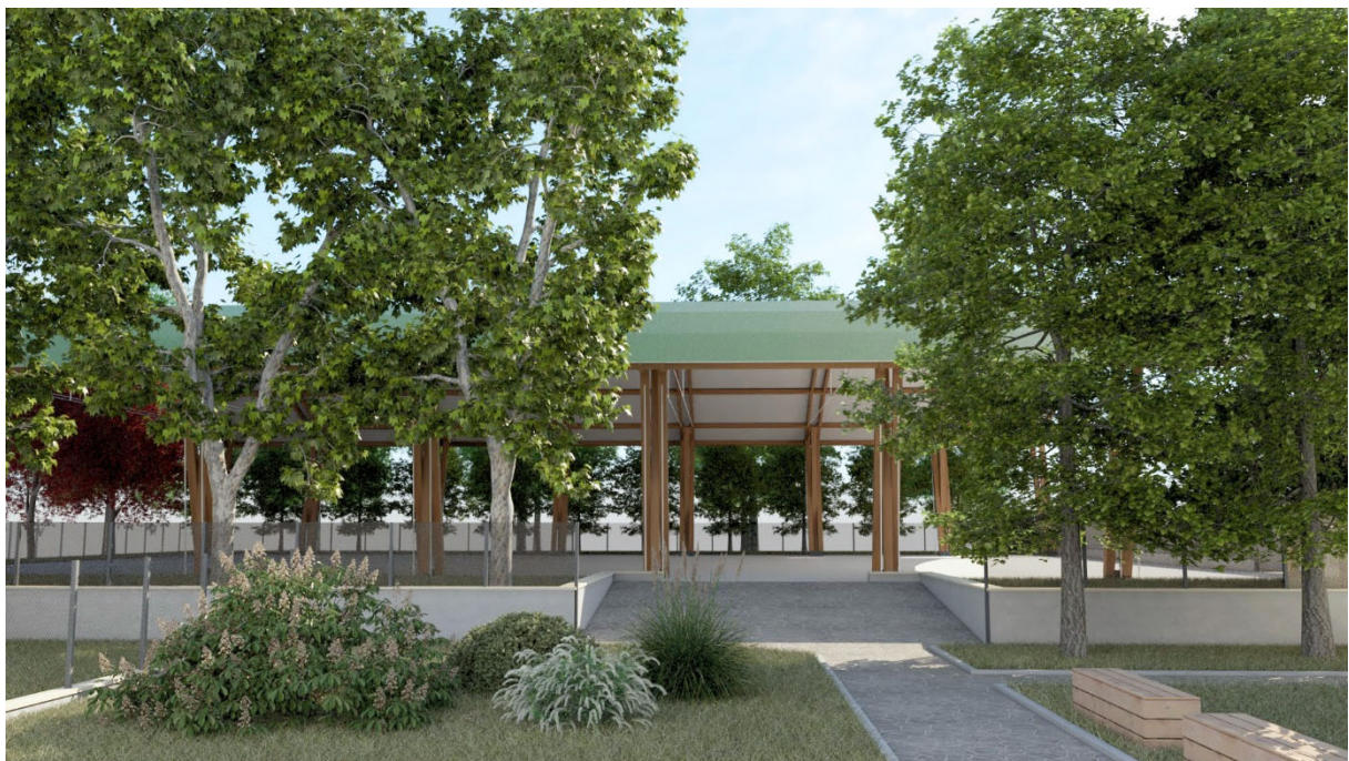
Progetto strutture sportive e sistemazione aree verdi via C. Colombo, 35 vista nord - est