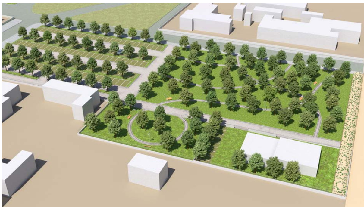
Vista est ipotesi di fattibilità progetto area urbana