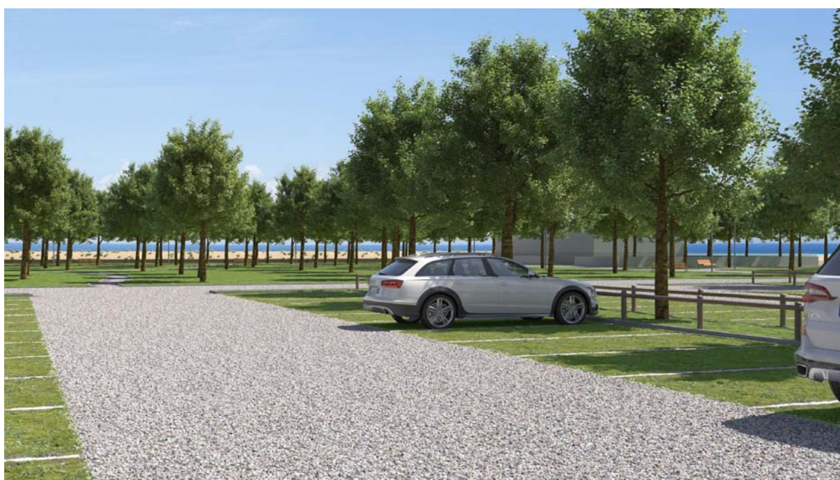
Dettaglio parcheggio scambiatore ipotesi di fattibilità progetto area urbana