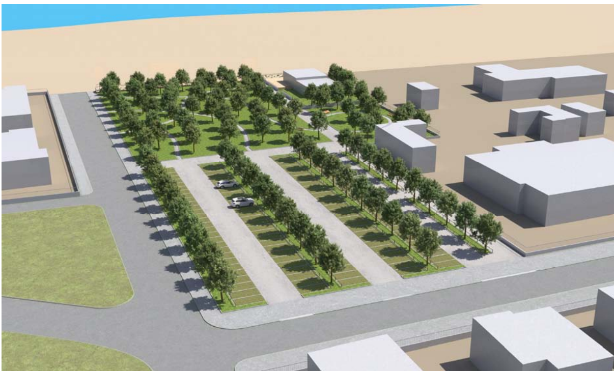
Vista ovest ipotesi di fattibilità progetto area urbana