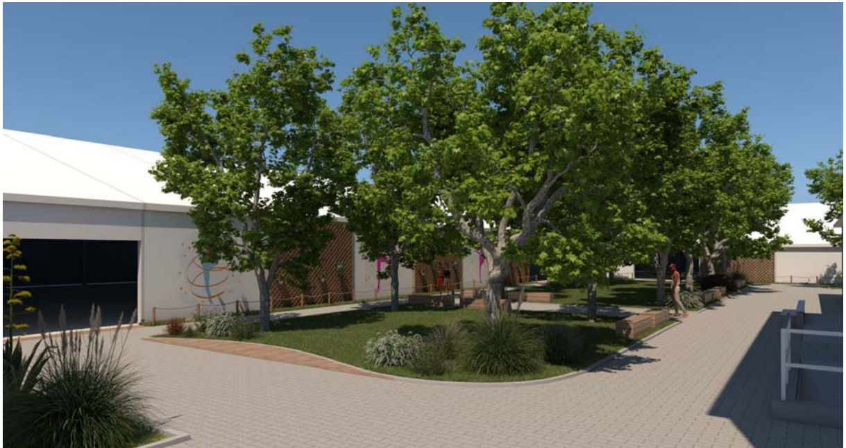
Progetto strutture sportive e sistemazione aree verdi via C. Colombo, 18 vista sud - ovest

Come già accennato, la seconda parte del progetto prevede la realizzazione di strutture sportive a servizio di colonie esistenti già in gran parte riqualificate; il nuovo intervento costituirà l'occasione per il completamento della riqualificazione delle colonie e la riqualificazione del verde nelle corti di pertinenza delle strutture. Anche la seconda parte del progetto persegue fortemente gli obiettivi del PUG permettendo la creazione di servizi sportivi, ricreativi ed il soddisfacimento dei diritti fondamentali delle attuali e future generazioni inerenti in particolare il diritto alla salute.